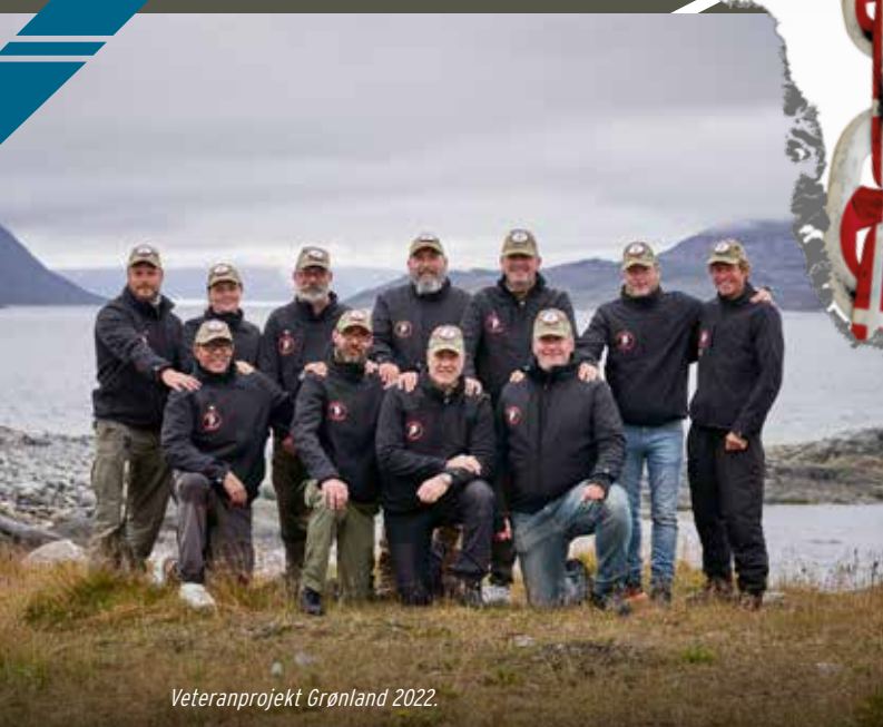
Veteranprojekt Grønland 2022.