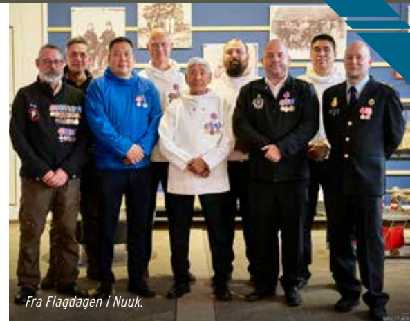
Fra Flagdagen i Nuuk.

Vores venner fra Nuuk Water Taxi fragtede os sikkert i havn til anløbet i Qooqqut - og vi gik