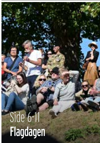
Side 6-11 Flagdagen