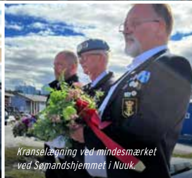
Kranselægning ved mindesmærket ved Sømandshjemmet i Nuuk.

Fordelt over en årrække forsøger Danmarks Veteraners hovedbestyrelse at aflægge besøg hos de enkelte medlemsforeninger.