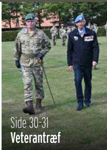
Side 30-31 Veterantræf