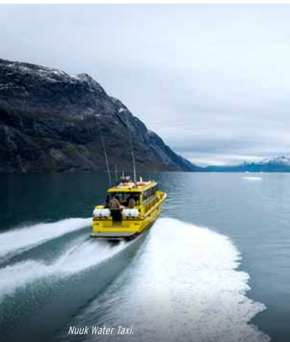
Nuuk Water Taxi.

Dagen startede med flaghejsningen på Sømandshjemmet i Nuuk, noget som er blevet en tradition, og som vi sætter en stor ære i. Herefter skulle vi sende den traditionelle live-hilsen og video hjem til flagdagsarrangementet til vores hjemkommune, Allerød.