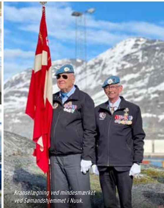
Kranselægning ved mindesmærket ved Sømandshjemmet i Nuuk.