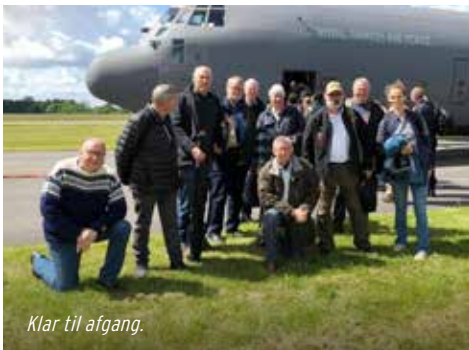
Klar til afgang.