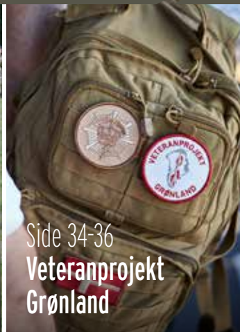
Side 34-36 Veteranprojekt Grønland