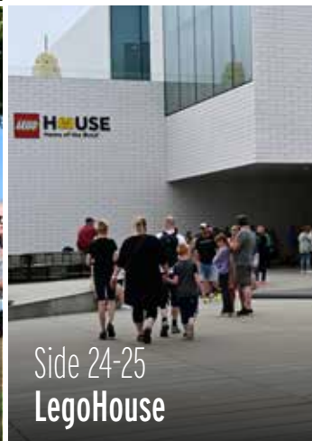
Side 24-25 LegoHouse